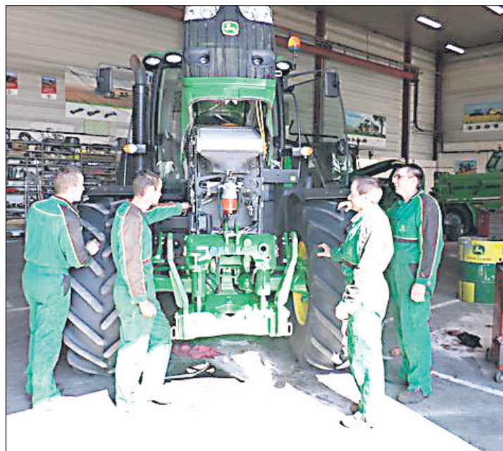
Formation du personnel des ateliers machinisme.